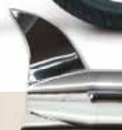
Fishtail - AF