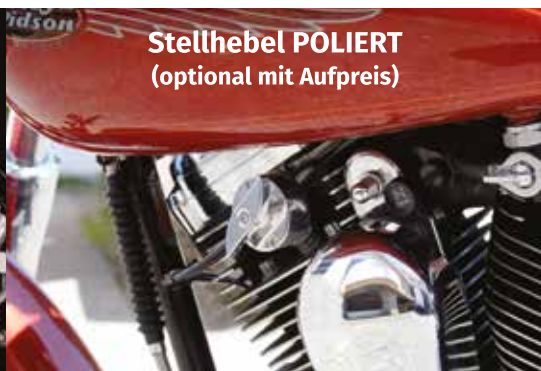
Stellhebel POLIERT (optional mit Aufpreis)