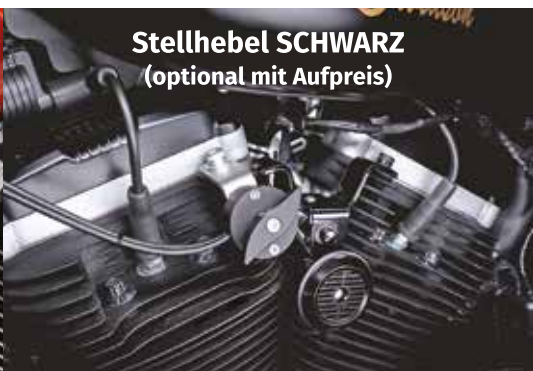
Stellhebel SCHWARZ (optional mit Aufpreis)