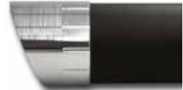
Short Straight Curve