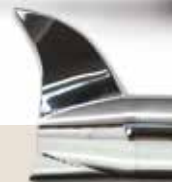
Fishtail - AF