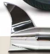
Fishtail - AF