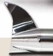
Fishtail - AF