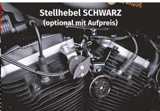
Stellhebel SCHWARZ (optional mit Aufpreis)