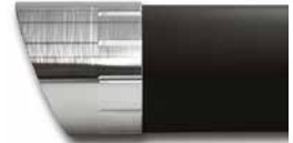
Short Straight Curve