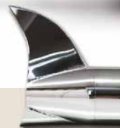
Fishtail - AF