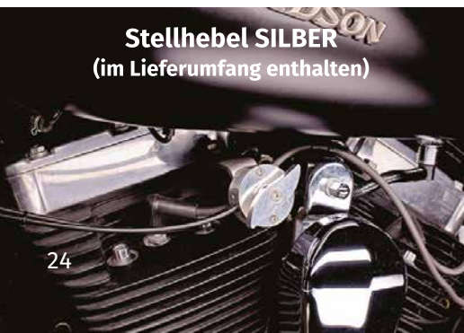
Stellhebel SILBER (im Lieferumfang enthalten)

Dieser Katalog ist gültig ab dem 02.05.2022. Preise gelten inkl. der gesetzlichen MwSt., zzgl. Versandkosten. Preisänderung vorbehalten. Mit dieser Preisliste werden alle früheren Preise ungültig. Lieferung erfolgt ausschließlich auf Grundlage unserer AGB. Irrtümer und Druckfehler vorbehalten. Die folgenden Namen und Modellbezeichnungen werden im Katalog von Penzl-Bikes GmbH® lediglich als Referenz verwendet: Harley-Davidson®, H.D.®, CAN-BUS®, Dyna®, Softail®, Sportster®, Tourer®, VRSC-Serie®, Buell®, Low Rider®, Switchback®, Fat Bob®, Wide Glide®, Low Rider S®, Street Bob®, Glide®, Super Glide®, Low Rider®, Fat Boy®, Nostalgia®, Deuce®, Deluxe®, Cross Bones®, Blackline®, Slim®, Rocker®, Breakout®, CVO Pro Street Breakout®, Classic®, Custom®, Heritage®, Night Train®, Standard®, Springer®, V-Rod®, Night Rod®, Street Rod®, Muscle®, XB-Reihe®, EFI®.