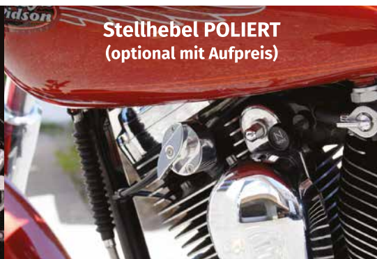
Stellhebel POLIERT (optional mit Aufpreis)