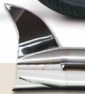
Fishtail - AF