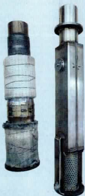
Rechts das Innenleben einer alten, manuell geregelten Anlage. Links die neue „V2-Speed“ mit Kugelventil. Die neuen Anlagen fallen kürzer aus

Ist die Bohrung dagegen geöffnet, vernehmt ihr Kraft und Herrlichkeit einer offenen Anlage. Bemerkenswert an diesem System: Bei offener Bohrung fließt die Strömung völlig ungehindert aus dem Rohr. Im Fall von Klappen sieht das anders aus, das offenbart uns ein Blick durch eine alte Penzl-Klappenanlage. Selbst eine geöffnete Klappe ist strömungstechnisch nämlich ein Hindernis, dessen Mechanik Verwirbelungen verursacht. Im Fall von Penzl gibt es dieses Hindernis nicht.