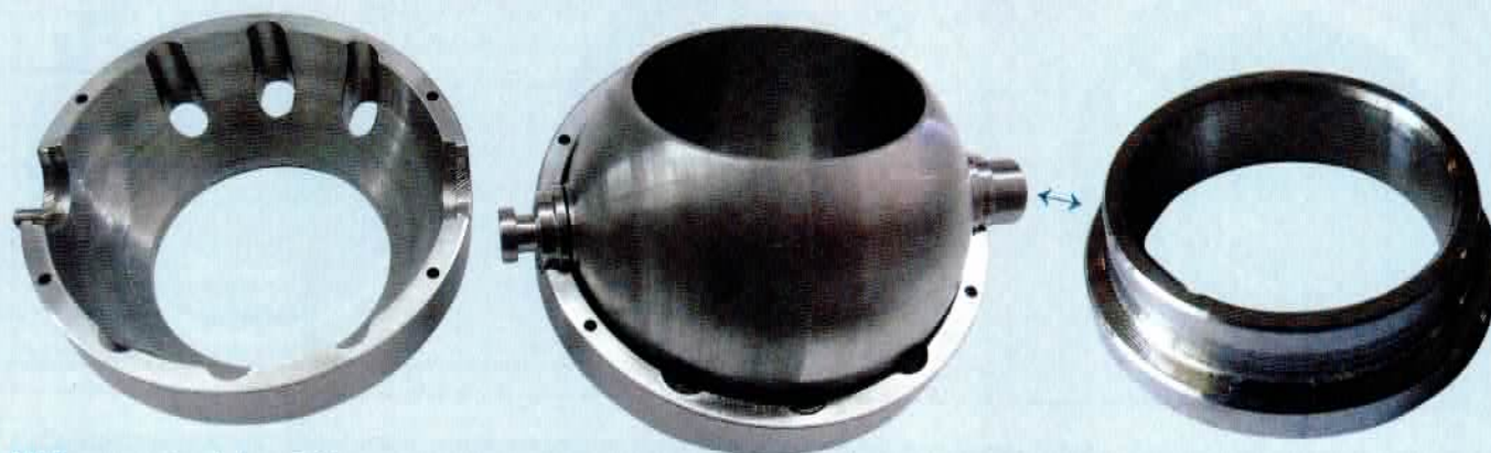
Alle Komponenten sind aus Edelstahl gefertigt. Nur das Material der Lagerringe ist geheim