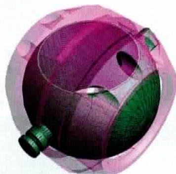
Die Grafik zeigt das System mit geschlossenem Kugelventil. Die hindurchscheinende Öffnung liegt quer zur Strömung

Penzl-Bikes ist ein Hersteller für Zubehör-schalldämpfer. In den letzten Jahren hat er sich mit verstellbaren Auspuffanlagen einen Namen gemacht. Sie sind bekannt für ihren basslastigen Sound und manuell verstellbar – und das ist bis jetzt nicht verboten. Es ist nur verboten, sie im Straßenverkehr mit geöffneter Klappe zu fahren. Und damit der Wachtmeister in der Lage bleibt, das nachweisen zu können, um vor Gericht noch weiteren Ärger zu vermeiden, ist es ratsam, den Verstellhebel für die Klappe weit weg vom Lenkergriff anzubringen, mindestens unterm Tank.