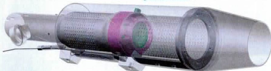
Das Kugelventil, eingebaut im Schalldämpfer. Unten befindet sich die Mechanik des Bowdenzuges, der die Kugel öffnet