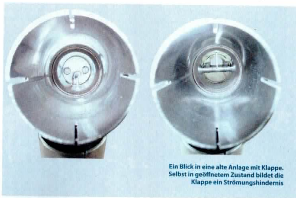
Ein Blick in eine alte Anlage mit Klappe. Selbst in geöffnetem Zustand bildet die Klappe ein Strömungshindernis

Es ist gut, unsere Brülltüte auch mal aus freiem Willen schließen zu können. Wir müssen ja nicht jedes Kleinkind am Straßenrand zum Heulen bringen