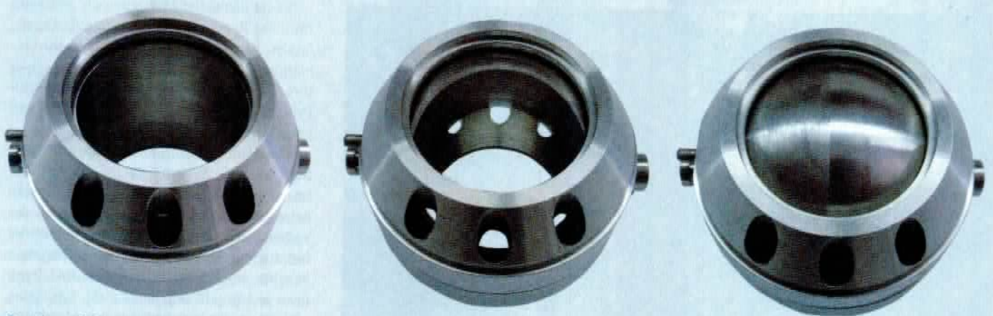
Das Herzstück von Penzls „V2 Speed“: offen, halboffen, geschlossen. Alle Zustände sind im City-Modus frei programmierbar. Im Gehäuse befinden sich die Nebenkanäle für den leisen Betrieb

Das elektronisch geregelte Soundmanagement bleibt mit Euro 4 zulässig – auch wenn die Messmethoden komplizierter geworden sind