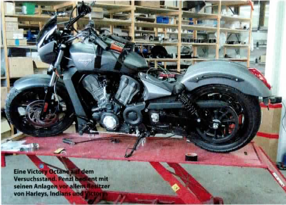
Eine Victory Octane auf dem Versuchsstand. Penzl bedient mit seinen Anlagen vor allem Besitzer von Harleys, Indians und Victorias

Penzl fuhr gut damit. Doch jetzt haben wir Euro 4. Für Bikes mit einer Erstzulassung ab dem 1. Januar 2017 und für Serienmotorräder, die schon in diesem Jahr als neue Typen eingeführt wurden, sind solche manuell verstellbare Systeme nicht mehr zulässig. Mit Ausnahmen für Kleinserien und Eigenbauten ist zu rechnen, auch der Altbestand darf nach wie vor mit einem manuellen System nachgerüstet werden – aber von solchen Ausnahmen wird ein Hersteller manuell verstellbarer Anlagen nicht leben können.