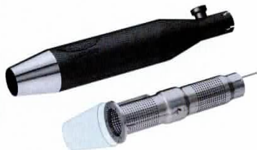
Das V2-Speed-System ist kürzer als das der manuell verstellbaren Schalldämpfer. Damit können die neuen Schalldämpfer auch kürzer gestaltet werden