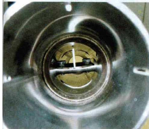
Oben ein System mit Klappe. Schön zu sehen: Achse, Klappe und Schrauben stehen mitten im Abgasstrom

Bei offener Bohrung fließt die Strömung frei aus dem Rohr. Klappen verursachen dagegen selbst geöffnet noch Verwirbelungen wegen der nach wie vor mitten in der Strömung stehenden Mechanik. Die Kugel ist, wie alle Komponenten der Anlage, aus Edelstahl gefertigt. Mit 90 Millimetern Durchmesser wiegt die Kugel allerdings 349 Gramm. Damit dürften Penzl-Anlagen schwerer ausfallen als die ihrer Mitbewerber. Ihr System ist in mechanischer Hinsicht umso faszinierender. <