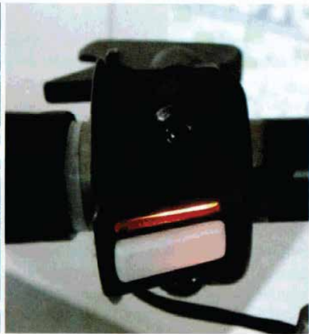
Auch das neue Penzl-System wird durch Bowdenzüge angesteuert (o. li.). Der Umschalter am Lenker ist ebenfalls eine Eigenentwicklung der Bayern (o. re.)