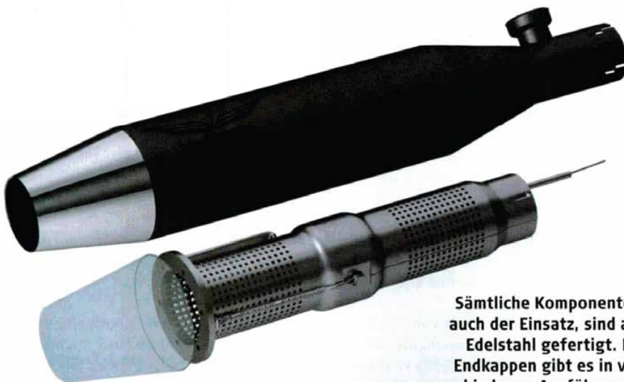
Sämtliche Komponenten, auch der Einsatz, sind aus Edelstahl gefertigt. Die Endkappen gibt es in verschiedenen Ausführungen

installieren. Hinzu kommt ein dreistufiger Schalter am Lenker. Alle Stufen sind legal, denn anders geht es ja nicht mehr. Eine Stufe schließt in den vorgeschriebenen Messbereichen, eine Stufe schließt permanent, eine dritte Stufe ist frei programmierbar, natürlich nicht in den vorgeschriebenen Messbereichen. Mechanisch ist das Klappensystem von Penzl ein Geniestreich. Die Anlage schließt nämlich nicht mit einer Klappe, sondern mit einer Kugel! Das Prinzip gleicht dem der Wasserhähne mit Kugelventil: Die Kugel hat eine Bohrung vom Innendurchmesser des Auspuffrohrs und dreht sich auf zwei Achszapfen. Liegt die Bohrung quer, entweichen Abgase und Geräusch durch die kleineren seitlichen Bohrungen im Gehäuse der Kugel, die Anlage ist dann leise.