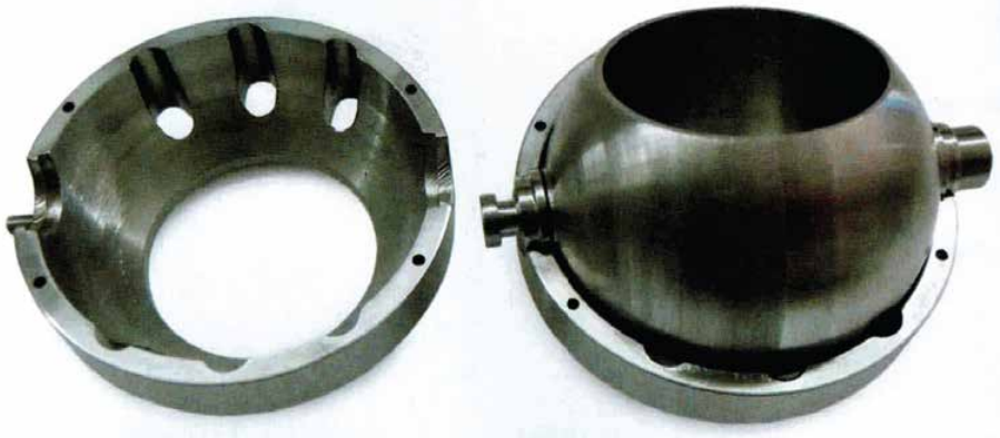
Das Kugelventil besteht aus drei Teilen. Bei geschlossenem Ventil strömen die Abgase durch die sechs außen sitzenden Löcher